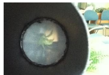
レンズを使ったカメラ